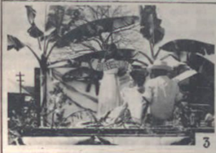
1.- REUNION DE VECINOS PARA LA ORGANIZACION DEL DIA DE LA ALFABETIZACION.